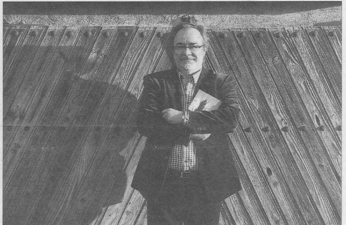
El autor cree que aún estamos a tiempo de recuperar la vida de los pueblos. / MIRIAM CHACÓN (ICAL)

Pero no todos tienen ese peso nostálgico. De Dios también le pone ternura a historias como las que cuenta en La niña que pidió a los Reyes un majuelo , El coleccionista de milagros o La Virgen de la Lumbre , relatos que se adaptan igual a su Guarrate natal que a la Tierra de Campos o la Bureba burgalesa. «Procedo de una familia de agricultores y toda mi vida he estado muy unido al campo, pero los cuentos no hablan de ningún pue-